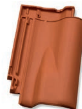
Ventilatiepan luchtopening ca 15 cm 2