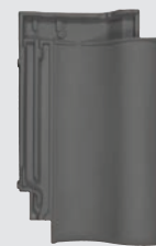
blauw gesmoord (876)