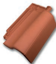
Gevelpan rechts dekkende breedte ca 175 mm