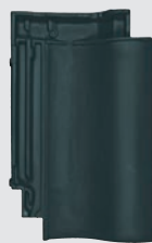
altfarben engobe (866)