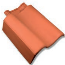
Gevelpan links dekkende breedte ca 275 mm