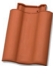
Dubbele welpan dekkende breedte ca. 302 mm

Minimaal 10 mm. ruimte houden tussen gevelpanflap en boeiboord!