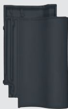
matzwart engobe (868)