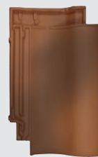
rood rustiek genuanceerd (812)