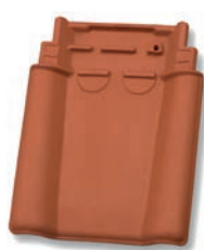
Dubbele welpan dekkende breedte ca. 238 mm