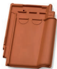
Halve pan dekkende breedte ca. 195 mm

Dekkende breedte dubbele welpan: ca. 238 mm Minimaal 10 mm. ruimte houden tussen gevelpanflap en boeiboord!