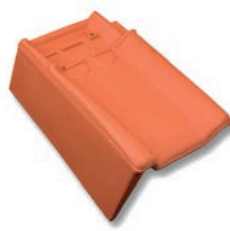
Gevelpan links dekkende breedte ca. 192 mm