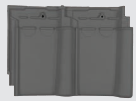
blauw gesmoord (876)

*projectgericht met afnameverplichting te leveren