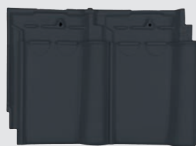
Matzwart engobe (868)