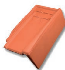
Gevelpan rechts dekkende breedte ca. 140 mm