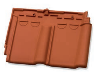
Ventilatiepan luchtopening ca. 11 cm 2