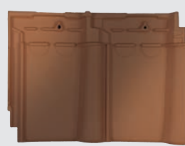
rood rustiek genuanceerd (812)*